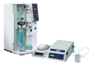
下: 分析装置イメージ図