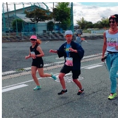
法被姿でマラソン大会出場!

さて、私の趣味は学生時代から続けている陸上長距離と水泳であり、体力には少しだけ自信があります。マラソン大会に出る時には、会社から許可をいただきアピールもかねて法被を着て走つてたりもしています。もし見かけたら声をかけてください(笑)