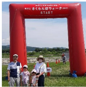
さくらんぼウォークに参加

会話の流れで趣味は何かと問われることがある。どちらかというところ、広く浅く興味を持つ性格かと自己分析する。春になれば仲間と山菜採りに行き、ゴルフに誘われれば喜んで参加する。健康が気になるとランニングをし、ちょっと疲れがたまれば日帰り温泉施設でのんびり過ごすことも。初夏には家族とウォーキングをし、今年には月山でキャンプもした。酒造りが一段落すると